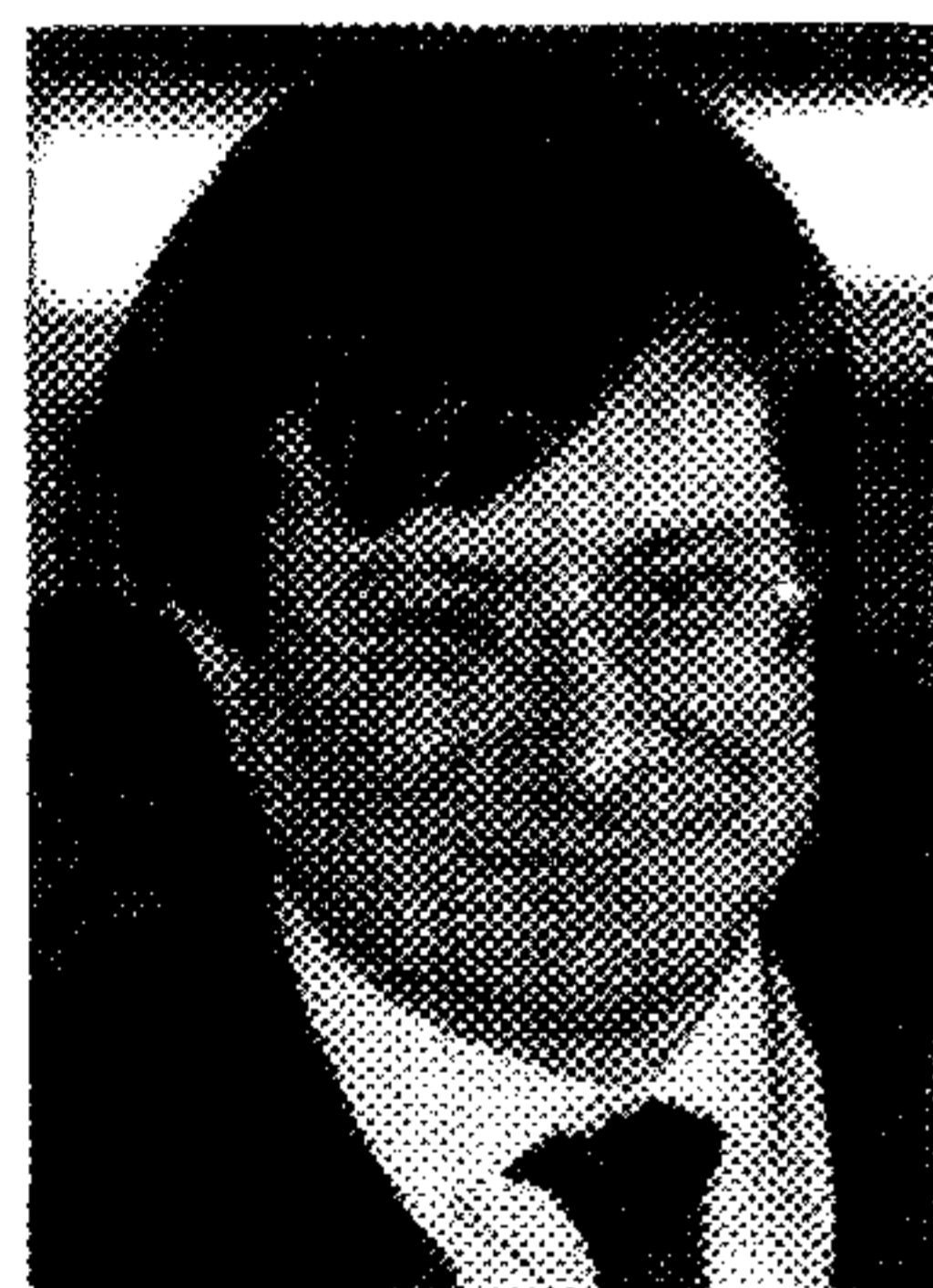
© FIORENZO GALLI, DIRETTORE GENERALE MUSEO NAZIONALE DELLA SCIENZA E DELLA TECNOLOGIA 'LEONARDO DA VINCI'

sezioni museali e i progetti culturali. Il livello è molto alto sia da un punto di vista dei servizi educativo-didattici sia per quel che riguarda la conservazione e valorizzazione delle collezioni. Si afferma incessantemente l'esigenza di intervenire con un progressivo processo di adeguamento e rinnovamento, rispetto a un passato lontano, anche di ordine normativo e strutturale. Proprio in corrispondenza di questa trasformazione in Fondazione ha avuto inizio un efficace lavoro di riorganizzazione amministrativa e di investimento in capitale umano. La selezione di un nuovo team è avvenuta privilegiando alcuni aspetti caratteriali delle persone come l'inclinazione speciale alla cultura, la dedizione e la disponibilità a dare il massimo con grande passione". Il rapido evolversi e arricchirsi del Museo come struttura e organizzazione ha favorito lo sviluppo di un settore dedicato agli eventi, sia per le manifestazioni interne, sia per quelle organizzate da altre società. "Il Museo ospita convegni, meeting,