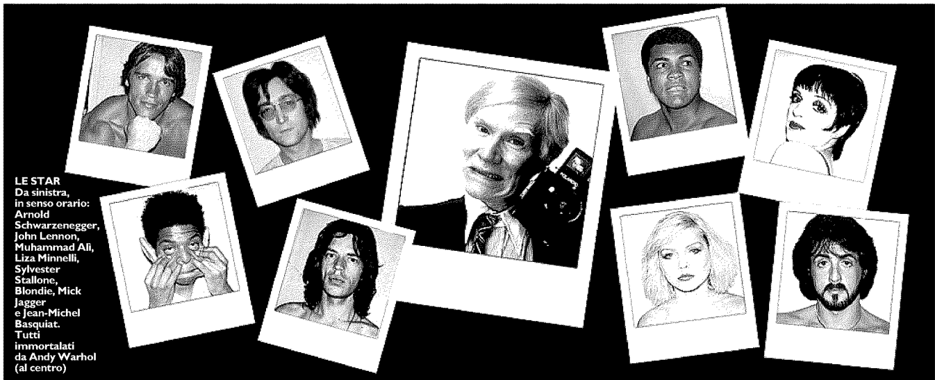
LE STAR Da sinistra, in senso orario: Arnold Schwarzenegger, John Lennon, Muhammad Ali, Liza Minnelli, Sylvester Stallone, Blondie, Mick Jagger e Jean-Michel Basquiat. Tutti immortalati da Andy Warhol (al centro)